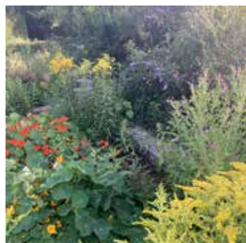
Elke hügel heeft zijn eigen beplanting. Zo groeit er wel veel, maar ziet het er toch overzichtelijk uit.