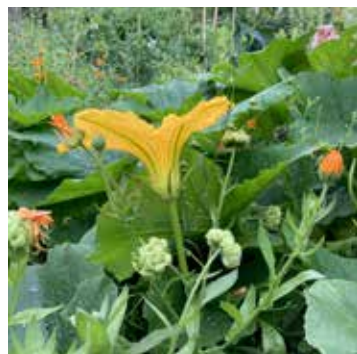
Alle planten slaan enorm aan.