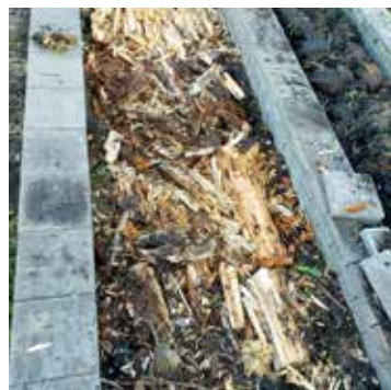
Oud, vergaand hout vormt de basis van het hügelbed.

"Een verhoogd bed dat vanuit een kuil is opgebouwd uit organisch materiaal zoals houtsnippers, takken, bladeren en ander snoeiafval, dat met aarde wordt bedekt. Het staat ook wel bekend als een 'hügelbed'. Het idee achter een heuvelbed is dat het onderliggende organische materiaal dat na verloop van tijd composteert, voedingsstoffen afgeeft aan de planten die er bovenop groeien. Terwijl het organische materiaal afbreekt, ontstaan er ook luchtruimtes en vochtophopingen, die leiden tot een gezondere en vruchtbaardere bodem. En door de waterconservering en verbeterde bodemgesteldheid krijg je een verhoogde opbrengst van de planten die erop groeien. Forrer ziet het hügelbed als het nabootsen van een bos. De bovenste rottende lagen worden elk seizoen afgedekt met een nieuwe laag. De nieuwe bomen groeien allemaal op dood maar ook vochtig hout en doordat het hout afbreekt, heeft die laag een constante temperatuur. Het is simpelweg tuinieren met dood materiaal."